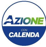
Gruppo Consiliare Azione