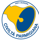
Gruppo Consiliare Civiltà Parmigiana